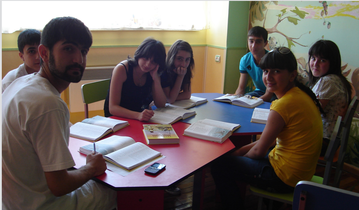
Աստվածաշնչի ուսումնասիրության դաս

Ծրագրի բաղադրիչներից էր նաև «կանաչ» հյուրընկալության միջավայրի ստեղծումը՝ ներառյալ ճաշարանը, ուր ուխտավորներին մատուցվում է հայկական ավանդական և առողջարար սնունդ գունազեղ վայրում՝ վերականգնված հայկական հին ապրելակերպով: 40 կարիքավոր և/կամ սահմանափակ հնարավորություններով երիտասարդներ սովորել են ազգային խոհանոցի գաղտնիքները, իսկ յոթը (4 աղջիկ և 3 տղա) արդեն աշխատում են այստեղ: Արդեն ճաշարան են այցելել 2300 հյուր՝ համտեսելով տեղական առողջարար սնունդը: