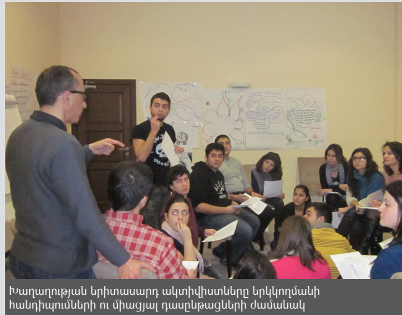
Խաղաղության երիտասարդ ակտիվիստները երկկողմանի հանդիպումների ու միացյալ դասընթացների ժամանակ

Ծրագրի այս փուլը իր ավարտին մոտեցավ 2011 թ-ի նոյեմբերին և, հիմնվելով այն առաջարկների վրա, որ հնչեցրել է 2010 թ-ին Շվեյցարական Խաղաղություն (Swiss Peace) կազմակերպությունը ծրագրի վերջնական գնահատման ժամանակ, նախաձեռնող խումբը 2011 թ-ի նոյեմբերից սկսեց ծրագրի նոր փուլ, որը կտևի մինչև 2014 թ-ի հոկտեմբերը: