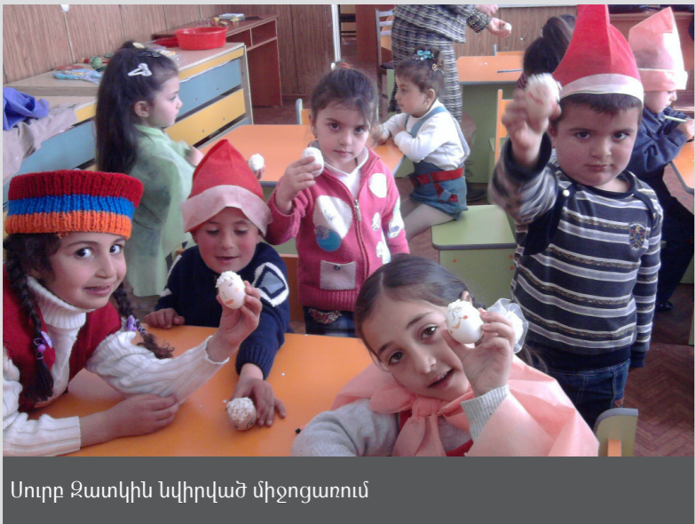
Սուրբ Զատիկին նվիրված միջոցառում