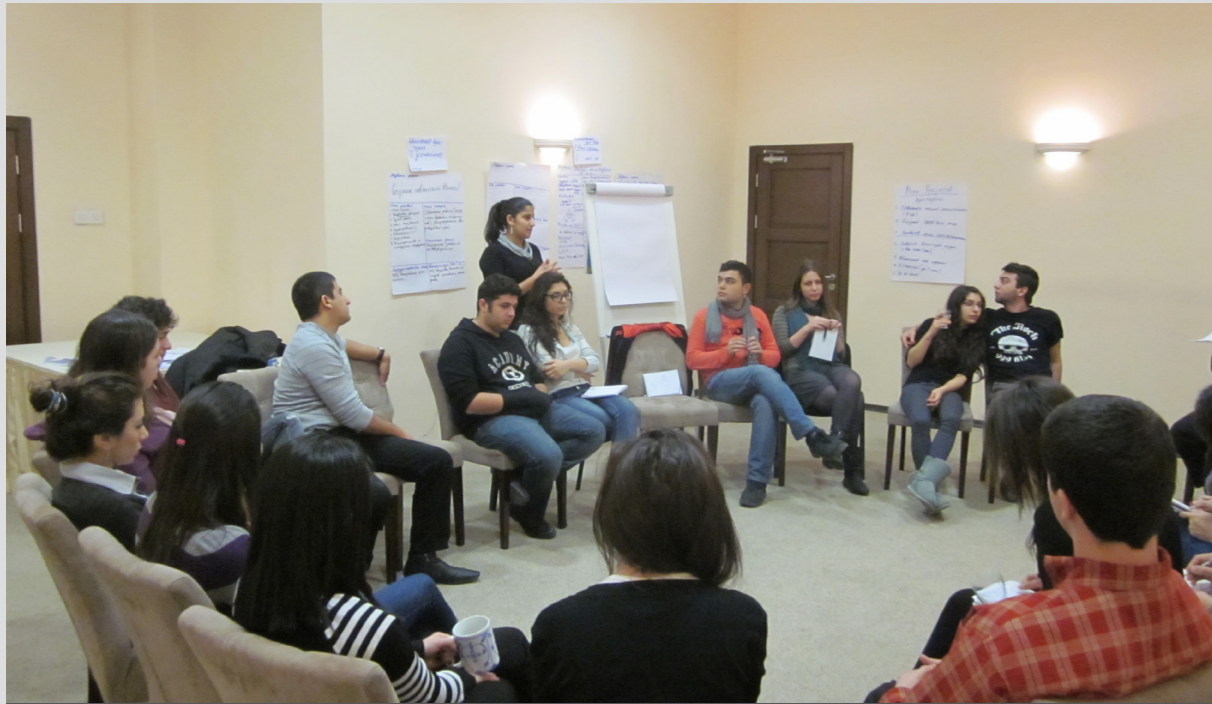
Խաղաղության երիտասարդ ակտիվիստները երկկողմանի հանդիպումների ու միացյալ դասընթացների ժամանակ