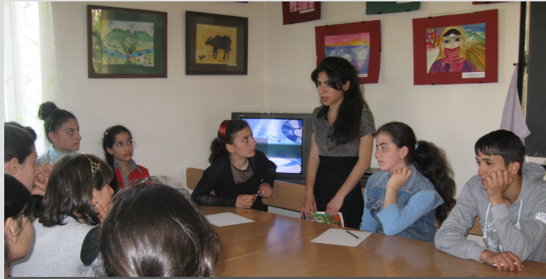
Մեծամորի երիտասարդական ակումբ

անդամների միջև: Նկատելիորեն բարելավվել է ընտանեկան մթնոլորտը, օր՝ գրանցվել է ֆիզիկական բռնության նվազում 28%-ով, 44%-ով պակասել է հոգեբանական բռնությունը, 20%-ով քիչ են երեխաների անտեսման դեպքերը և այլն: