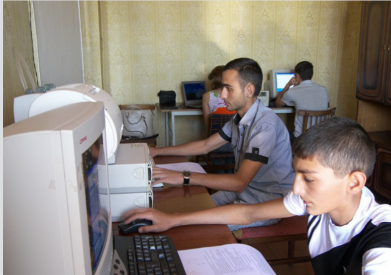
Համակարգչային դաս "Սոցիալական աջակցության կենտրոն" ՀԿ-ում

իրազեկության բարձրացման միջոցառումների շարք են իրականացրել Երևանում և շրջաններում: Մի շարք սեմինարներ են կազմակերպվել բանակում և բանտերում: Բազմազան միջոցառումներ են կազմակերպվել Կենտրոն այցելող թե երեխաների, թե մեծահասակների համար՝ ուխտագնացություններ, զբոսախնջույքներ, արձակուրդներ Սևանա լճում, որոնք շատ կարևոր են Կենտրոնի շահառուների հանրայնացման համար: