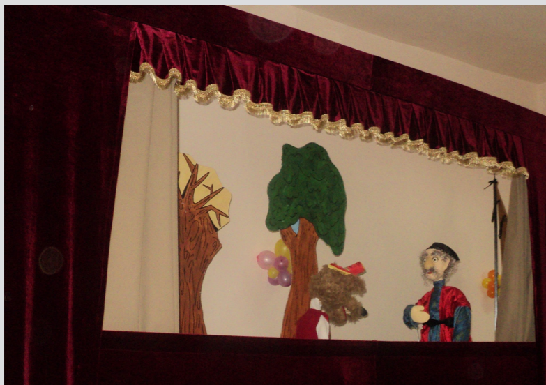
Գավառի կենտրոնի տիկնիկային թատրոնի խմբակը

Ծրագրի ընթացքում սկսվել է կենտրոնի ռազմավարական պլանի մշակման գործընթացը: Ստեղծվել է 15 աշխատատեղ և երկու փոքր ձեռնարկություն (փուռ, գորգագործական/ ասեղնագործության արհեստանոց):