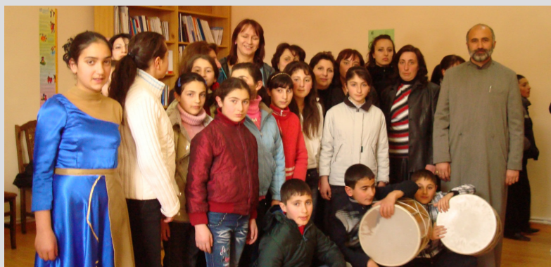
Գավառի համայնքային կենտրոնում