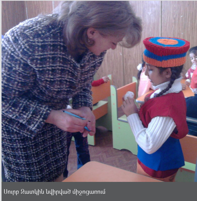
Սուրբ Զատիկին նվիրված միջոցառում