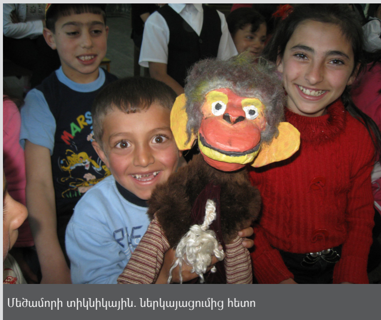
Մեծամորի տիկնիկային. ներկայացումից հետո

2011 թ. Կենտրոնի ուսումնական խմբեր հաճախել են 4 - ից 17 տարեկան 160 երեխա, 15 երիտասարդներ ներգրավված են եղել երիտասարդաց միության գործունեության մեջ, 12 տարեց ստացել է սոցիալական աջակցության և տնային խնամք, մոտ 30 տնայցեր են կատարվել և տեղական համայնքների մոտ 200 անդամների մասնակցությամբ հանդիպումներ և միջոցառումներ են իրականացվել: