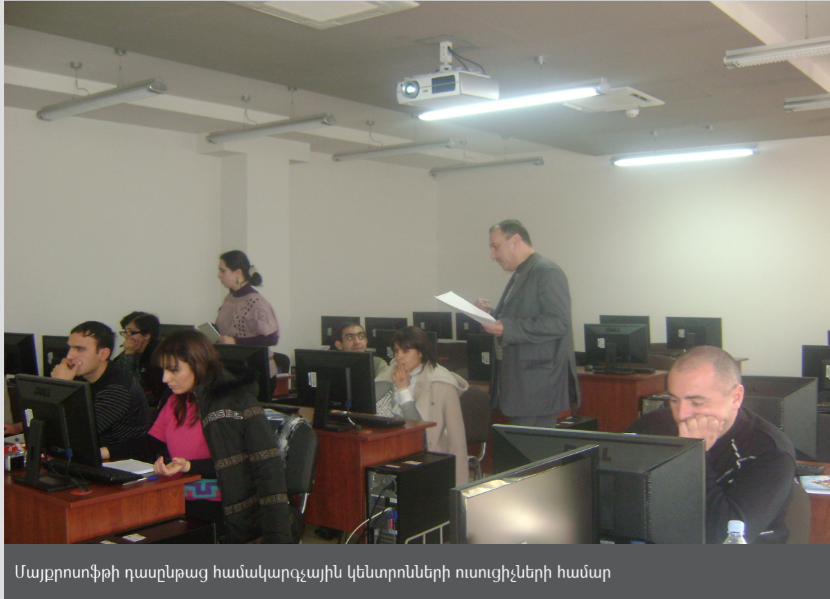
ՄայքրոտՖիթի դասընթաց համակարգչային կենտրոնների ուսուցիչների համար

Առաջարկվող ծրագիրը եզակի է և, հաշվի առնելով Արևելյան Եվրոպայի տարածաշրջանում ծրագրի եզակիությունը, ձեմարանի դասախոսական կազմի բարձր պրոֆեսիոնալիզմը, մշակված ուսումնական պլանը, հետագայում առարկան կարող է դառնալ Կենտրոնական և Արևելյան Եվրոպայի երկրներում կրկնօրինակման համար լավ մոդել, ինչը կբնակարկվի 2012 թ-ի նոյեմբերին Գևորգյան Հոգևոր ձեմարանում կազմակերպվելիք տարածաշրջանային կոնֆերանսի ընթացքում, որին կմասնակցեն Արևելյան Եվրոպայի, Կենտրոնական Ասիայի հավատարհեն կազմակերպությունների առաջնորդներ, ինչպես նաև հրավիրված խոսնակներ և գիտական համայնքի ներկայացուցիչներ ՄԹ-ից (Օքսֆորդ) և Շվեյցարիայից (Եկեղեցիների համատեղ գործողություն այլապես):