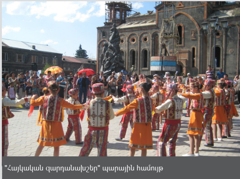
"Հայկական զարդանախշեր" պարային համույթ

2011 թվականին ևս կենտրոնի աշխատակազմն ու կամավորները կանոնավոր կերպով ընդգրկվել են կարողությունների զարգացման դասընթացներում, որպեսզի առավել արդյունավետ կարողանան ծառայություններ մատուցել սոցիալական, կրթական, երիտասարդական ծրագրերի և հանրային աշխատանքների ոլորտում: Անցկացվել են մի շարք ուսուցողական դասընթացներ ու քննարկումներ՝ սոցիալական աշխատանք և սոցիալական դիակոնիա, մարդու իրավունքներ, գենդերային հարցեր, սոցիալական գործընկերություն, կառավարում, շրջակա միջավայրի պաշտպանություն, առաջնորդություն, համայնքային մոբիլիզացիա և այլ թեմաներով: Կենտրոնն արդեն մշակել և զարգացրել է մի շարք մոդուլներ սոցիալական, կրթական, մշակութային, երիտասարդական և կամավորական աշխատանքների համար, մշակել և իրականացրել է ֆոնդահայթայթման իր ծրագիրը, կապեր է հաստատել տեղական և միջազգային կազմակերպությունների հետ: