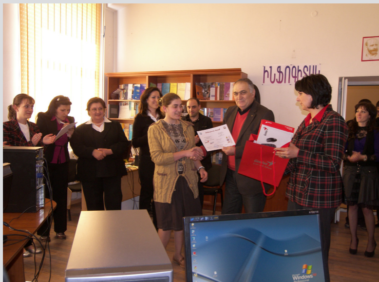
"Ինֆոգիտակ" համակարգչային մրցույթ Գյումրիի սոցիալական կենտրոնում

Ծրագրում ներգրավված են եղել հասարակության խոցելի խմբերը՝ երիտասարդներ, կանայք, գործազուրկներ, սոցիալապես անապահով խավեր, ավելի քան 3000 մարդ մասնակցել են համակարգչային կենտրոնների