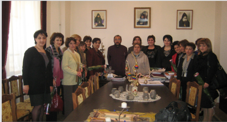
Բուժքույրերի օրվան նվիրված հանդիպում Շիրակի թեմի Առաջնորդ Տեր Միքայել եպս. Աջապահյանի հետ

Ծրագրի թիրախային խմբերն են սոցիալապես անապահով մարդիկ, երեխաները, երիտասարդ կանայք, տարեցիները, հաշմանդամները, համայնքային ու մարզինալ խմբերը (թրաֆիկինգի զոհերը, օրինազանց և տևանկ մարդիկ և այլն), գործազուրկները և հոգեբանական խնդիրներ ունեցողները: