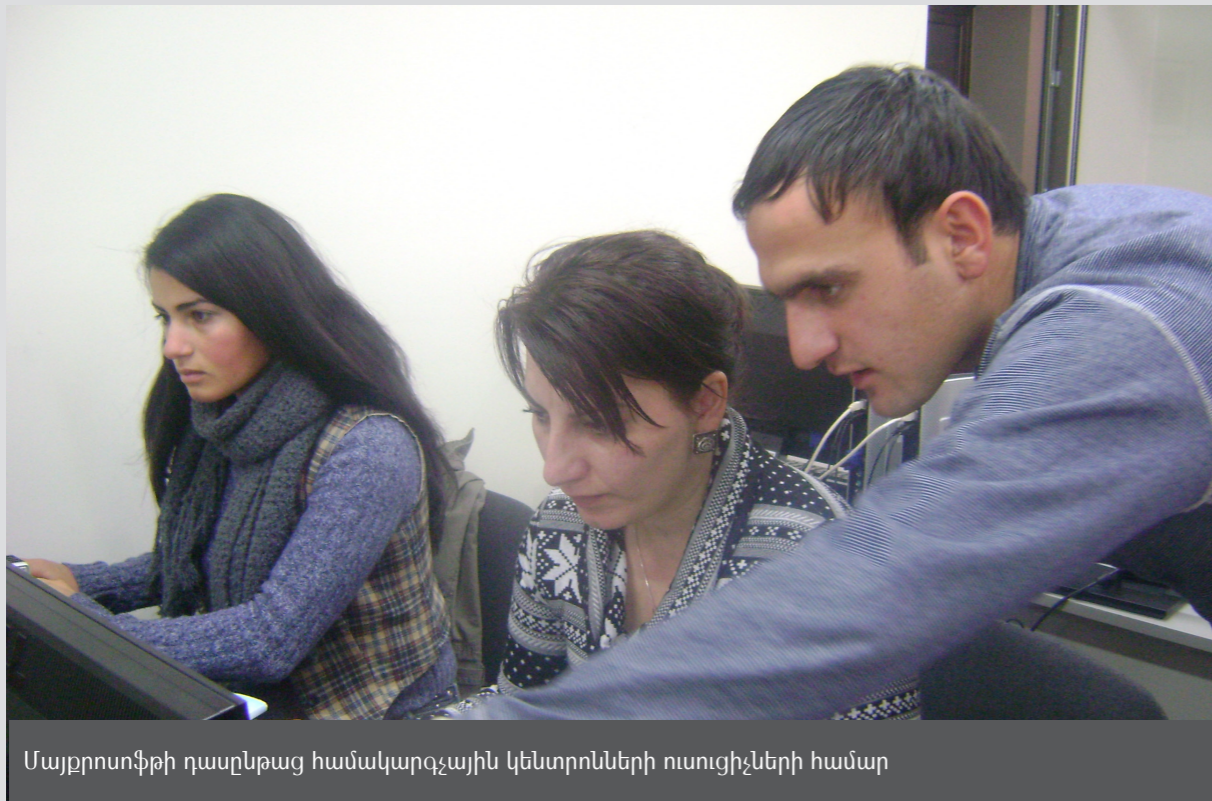
Մայքրոսոֆթի դասընթաց համակարգչային կենտրոնների ուսուցիչների համար

1. Վերապատրաստման դասընթացներ 2011թ-ի դեկտեմբերին և 2012թ-ի հունիսին ՀԿՍ-ը Մայքրոսոֆթ-Հայաստանի հետ համատեղ իրականացրել է 2 վերապատրաստման դասընթացներ ընդգրկելով համակարգչային կենտրոնների 11 դասընթացավարների յուրաքանչյուր դասընթացում: Դասընթացների նպատակն է համակարգչային կենտրոնների աշխատակազմի համակարգչային հմտությունների և գիտելիքների բարելավումը որպես կարևոր նախապայման նրանց կարողությունների և պրոֆեսիոնալիզմի զարգացման և համակարգչային կենտրոններում որակյալ և արդյունավետ ուսուցման: