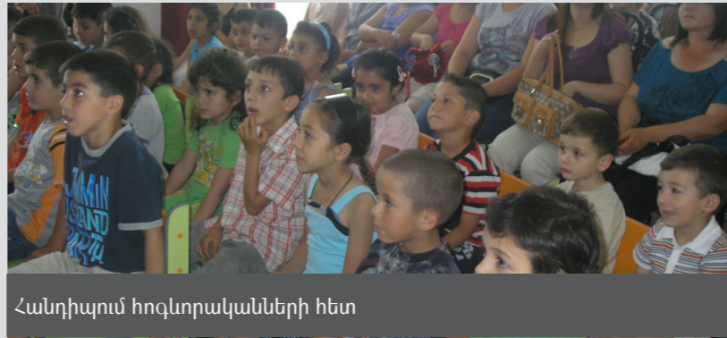
Հանդիպում հոգևորականների հետ

2011 թ. կենտրոնի 6 ուսումնական խմբակներն են հաճախել մոտ 155 երեխա: 15 մասնակիցներից բաղկացած եկեղեցական երգչախումբ է ստեղծվել, որն էլ պարբերաբար երգել է պատարագներին: 5 երիտասարդներ որպես սարկավագ ծառայել են համայնքի եկեղեցում: Կենտրոնի շրջանավարտները դասընթացներն ավարտելուց հետո էլ պահպանել են Կենտրոնի հետ կապն ու որպես կամավորներ աջակցել են դասավանդման և միջոցառումների կազմակերպման գործընթացում: