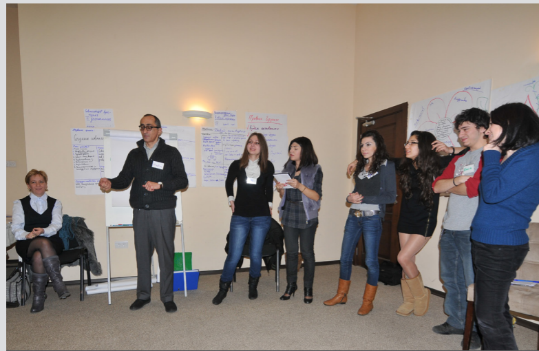
Խաղաղության երիտասարդ ակտիվիստները երկկողմանի հանդիպումների ու միացյալ դասընթացների ժամանակ

Հայաստանն ու Ադրբեջանը 1988 թ-ին սկսեցին պայքարել հայաբնակ Լեռնային Ղարաբաղի համար, որը Խորհրդային Ադրբեջանին է կցվել 1920 թ. Մոսկվայի կողմից: Պայքարը վերաժվեց իսկական հակամարտության այն ժամանակ, երբ երկու երկրները 1991 թ-ին անկախացան Սովետական Միության փլուզումից հետո: 1994 թ-ին հակամարտությունը սառեցվեց, իսկ հրադադարը շարունակվում է մինչև օրս: 1994 թ-ից ի վեր Եվրոպական անվտանգության և համագործակցության կազմակերպության հովանու ներքո գործող և Ֆրանսիայի, Ռուսաստանի ու ԱՄՆ-ի կողմից համանախագահվող Մինսկի խումբը համակարգում է հայ-ադրբեջանական բանակցությունների գործընթացը: Երկու երկրներն էլ որպես իրենց քաղաքական բանակցությունների հենակետ օգտագործում են Մինսկի խմբի 2007 թ-ի մադրիդյան առաջարկները: Կողմերի միջև շարունակվող անհամաձայնության աղբյուր են մադրիդյան սկզբունքների այն կետերը, որոնք վերաբերում են Լեռնային Ղարաբաղի կարգավիճակին և ինքնորոշման իրավունքին, ԼՂՀ տարածքային ամբողջականությանն ու նրա շրջակա տարածքներն Ադրբեջանին վերադարձնելուն, որոնք էլ հակամարտության արմատն են հանդիսանում: