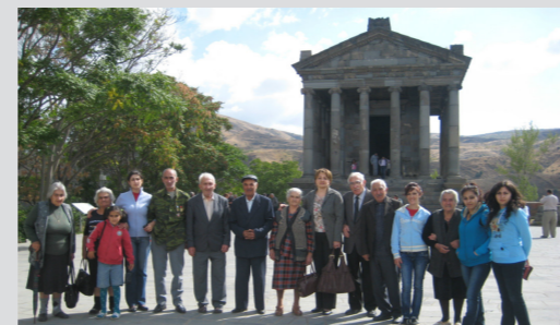
"Հերոնտոս" տարեցիների ակումբի ուխտագնացություն