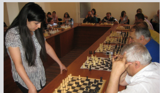
Շախմատի օրվան նվիրված միջոցառում