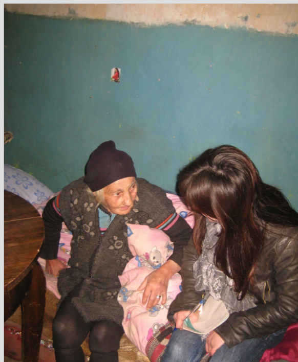
Օգնության բաշխում տևայցի միջոցով