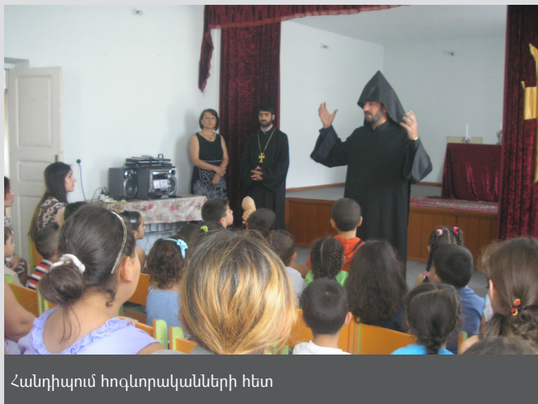
Հանդիպում հոգևորականների հետ

2011թ. սկսած ՀԱԵ Արմավիրի թեմը Թալինի տեխնիկական և մասնագիտական կրթության քոլեջի հետ համատեղ Կենտրոնում նախաձեռնել է մասնագիտական վարսահարդարման և մատնահարդարման դասընթացներ: Ինը երիտասարդներ Քարակերտից և հարևան գյուղերից ավարտել են այն, ստացել վկայականներ ՀՀ կրթության և Գիտության նախարարության կողմից և կիրառել ստացված հմտությունները իրենց համայնքների գեղեցկության սրահներում: