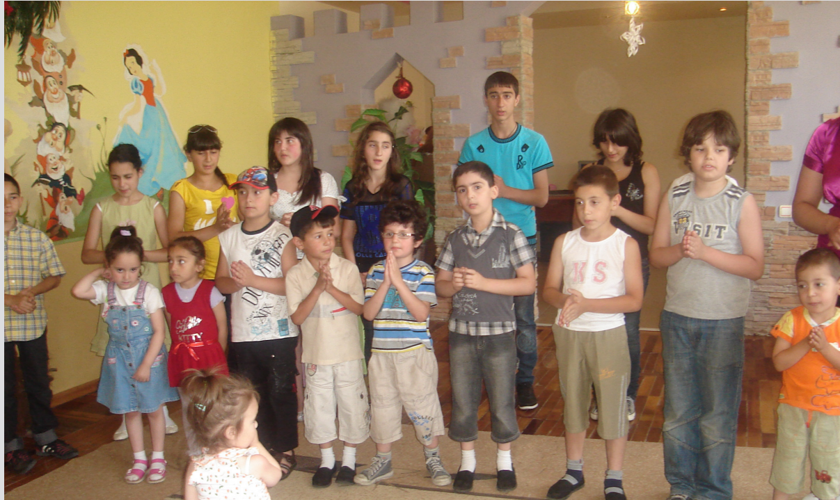
Ակումբային և սոցիալական վերահստեգրման միջոցառում երեխաների համար