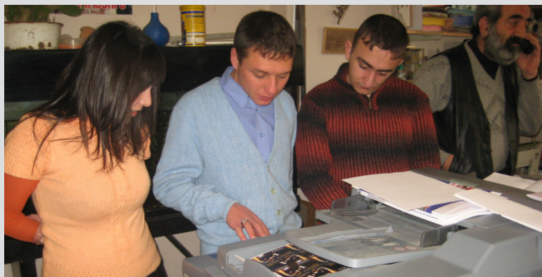
Միևի-տպարան: տձեռնահանում, գունավոր տպում, գրքերի կազմում, հրավիրատոմսերի, թերտոմսերի, հավաստագրերի պատրաստում