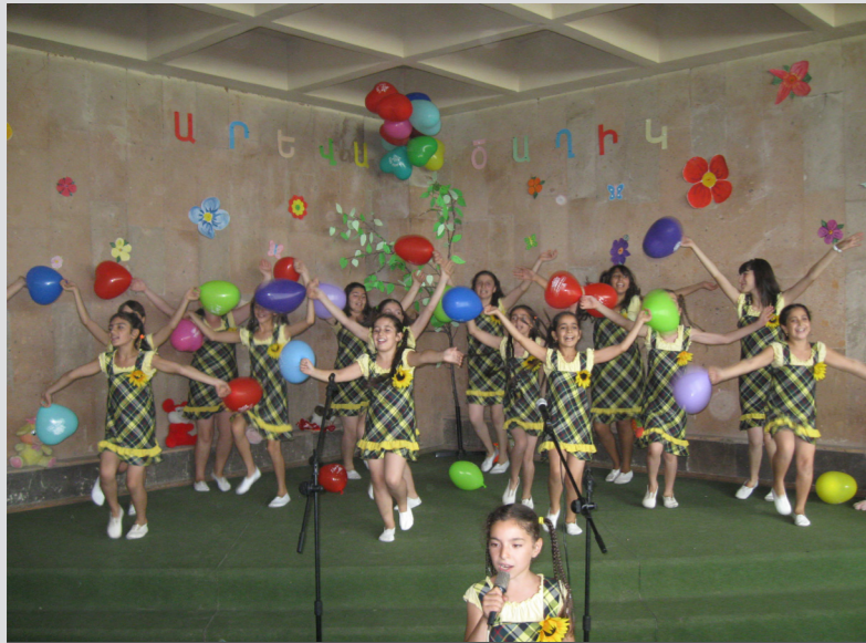
Մեծամորի կենտրոնի երգչախումբը