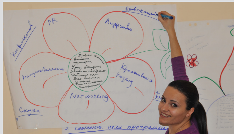
Խաղաղության երիտասարդ ակտիվիստները երկկողմանի հանդիպումների ու միացյալ դասընթացների ժամանակ